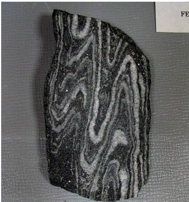
Рис. 1. Железистый кварцит.

ЗАДАНИЕ 2. Перед Вами фотография образца железистого кварцита (Рис. 1). Назовите текстуру руды и какими факторами были обусловлены такие текстурные особенности образца?